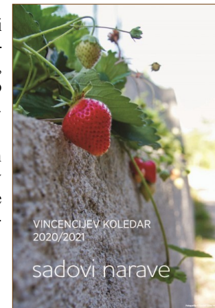
VINCENCIJEV KOLEDAR 2020/2021

Več o koledarju in namenu na spletni strani www.drustvo-vzd.si in na zadnji strani koledarja. Iskrena hvala za vsak vaš dar!